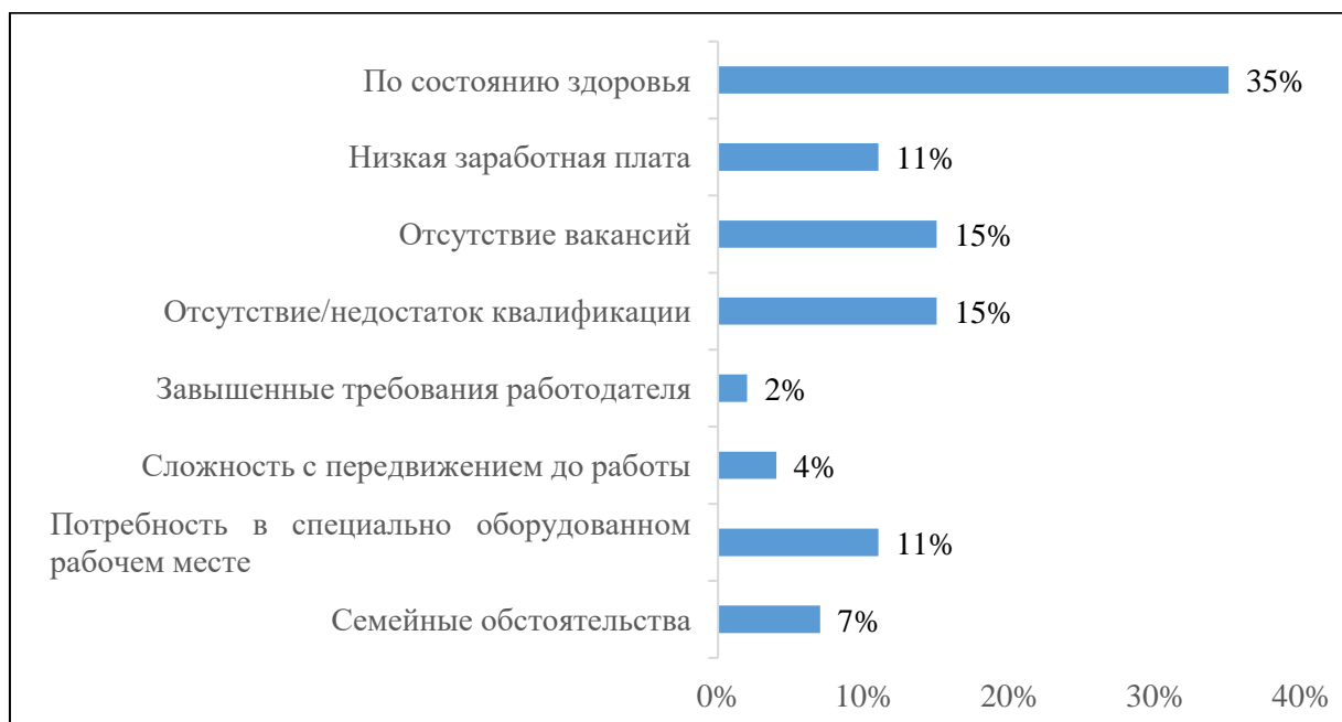
Рис. 5. Основные причины, препятствующие трудоустройству людей с ОВЗ

препятствий является состояние здоровья человека, и наименее важным – завышенные требования работодателей.