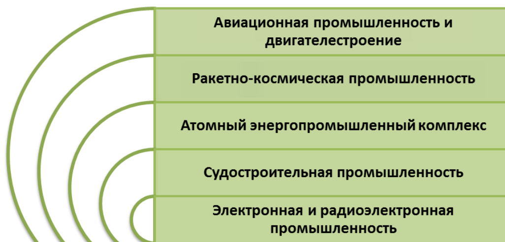
Рисунок 2. Направления деятельности Правительства РФ, в части высокотехнологичных отраслей промышленности

Правительством РФ 31.01.2013 утверждены основные направления деятельности Правительства Российской Федерации на период до 2018 года. В части высокотехнологичных отраслей промышленности выделены пять, они представлены на рис.2.