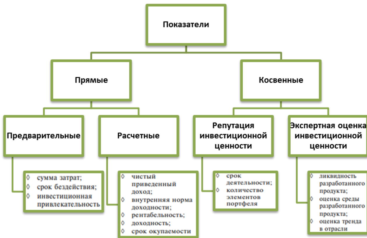
Рисунок 4. Система показателей для оценки эффективности инвестиций в НИОКР [2, с.222]

Таким образом, получение любого эффекта заключается в преобразовании имеющегося потенциала (ресурсов) организации в конечный результат процесса в виде продукта, информации или услуги, который при этом может обеспечить один или несколько видов эффектов.