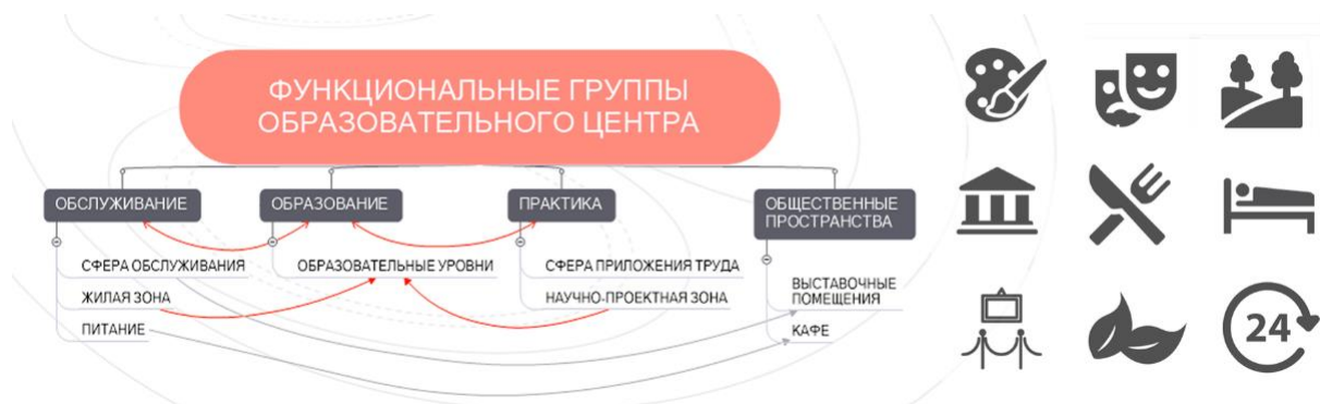
Рис. 2 Концепция взаимосвязей функциональных групп на примере проекта Центра непрерывного архитектурного образования в Санкт-Петербурге.