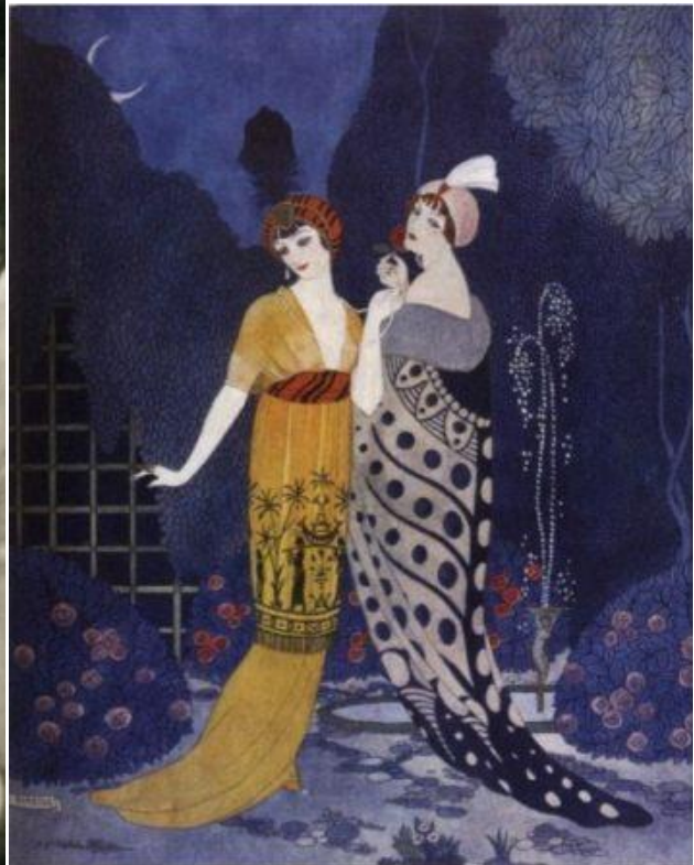
Рисунок 5 – П. Пуаре. Эскиз Ж. Барбье, 1912 г

6. Одним из первых он стал использовать рекламу своих моделей. Он привлекал