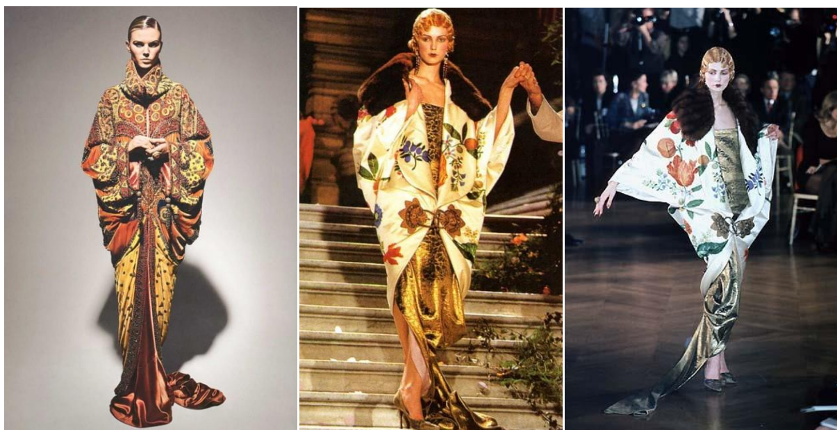
Рисунок 8 – Коллекция от кутюр, весна-лето 1998г. Джон Гальяно для Dior

Уже с конца 1950-х годов началось возрождение интереса публики к творчеству Поля Пуаре. Этот интерес был спровоцирован Денизой Пуаре, его женой и первой моделью, устроившей первую ретроспективную выставку его творений. Музеи моды по всему миру стали каталогизировать свои модели с грифом Paul Poiret. В эпоху хиппи, в конце 1960-х годов, в Нью-Йорке возникла мода на винтажные вещи от Пуаре. Выставки творчества кутюрье стали собирать толпы почитателей его таланта. Цены на его модели начали стремительно расти вверх, коллекционеры раскупали флаконы духов «Розин», подушки и коврики от «Мартин». Приверженцем стиля Поля Пуаре в 1990-е годы стал дизайнер Джон Гальяно. Его модели из коллекции 1998 года явно воспроизводят стиль великого кутюрье начала века (рис. 8) [12].