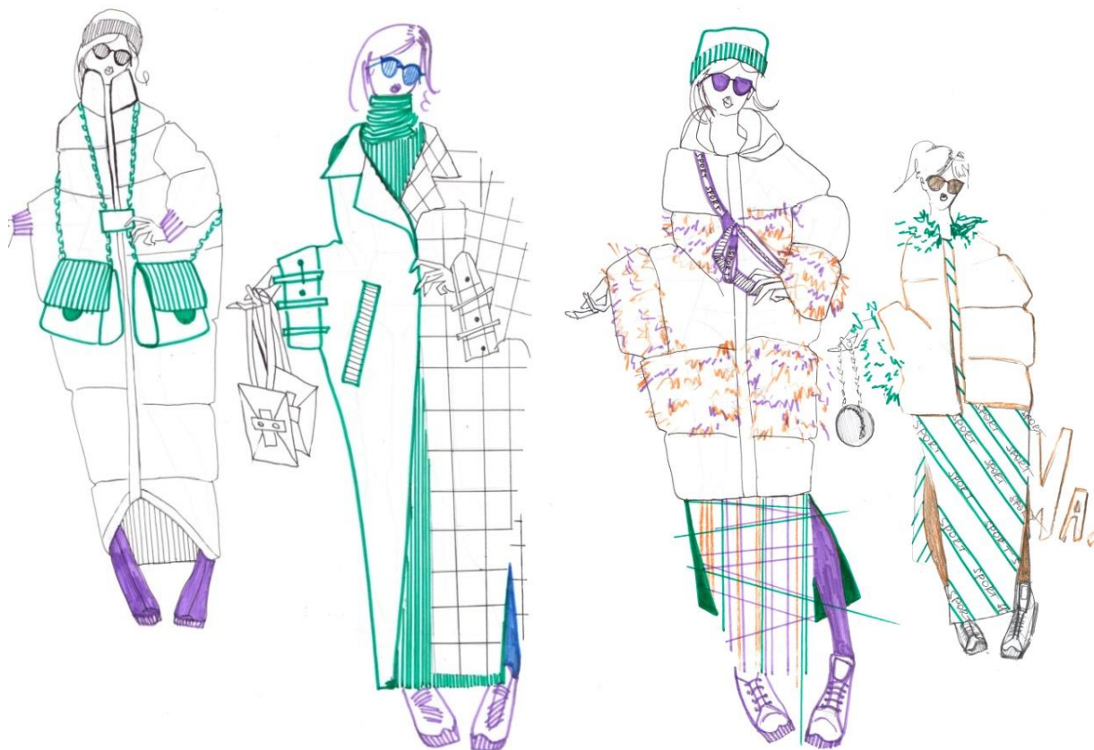
Рисунок 11 – Авторские эскизные решения по теме исследования