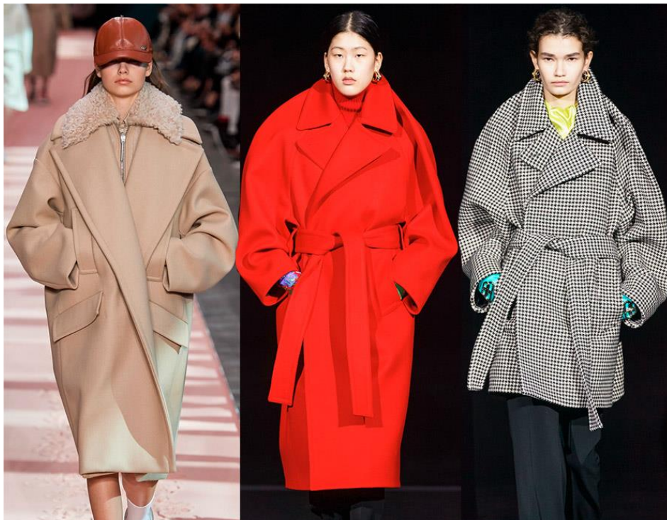
Рисунок 10 – Модели Tod's, The Row Sportmaxосень-зима 2019-2020