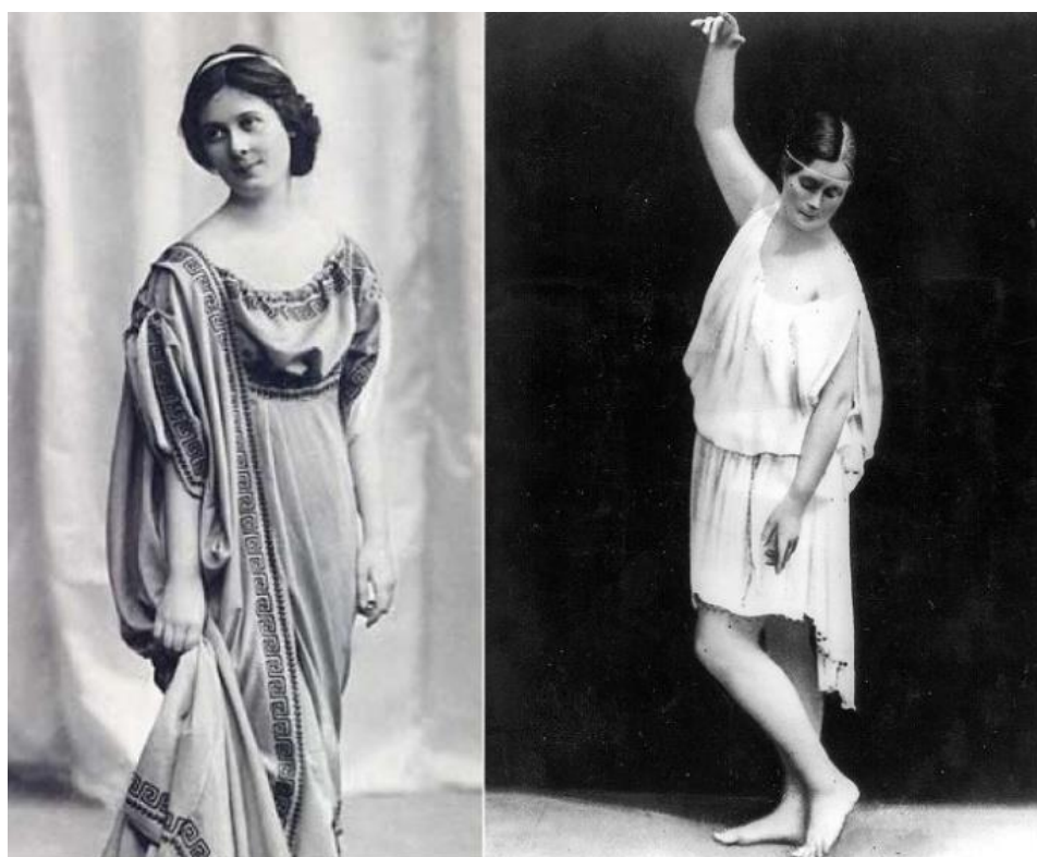
Рисунок 7 – Айседора Дункан танцует в платье от Поля Пуаре

7. Также Поль Пуаре создал собственную парфюмерную линию для создания полного