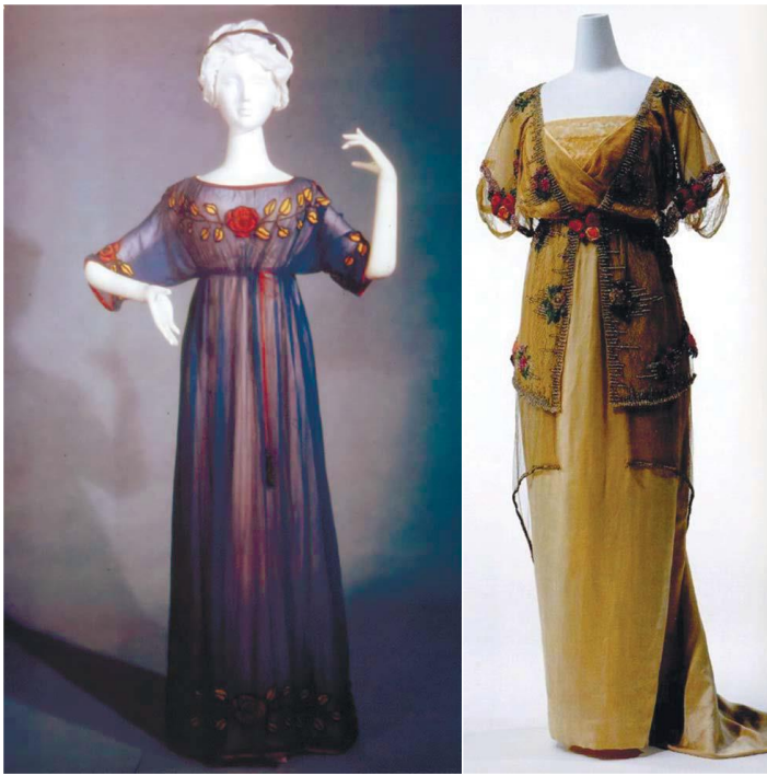
Рисунок 1 – Платья от Поля Пуаре

2. Отказ от нижнего белья, в частности от обязательной нижней юбки, которую женщины носили под верхним платьем, а также от корсета. Пуаре считал, что его платья должны быть легкими и струящимися чему и мешали нижние юбки. Следовательно, ушел в прошлое, создаваемый корсетом S-образный силуэт (рис.1) [12]. 3. Этнический стиль. Пуаре создал и впоследствии вошли в моду японские кимоно, китайские халаты, персидские шаровары и тюрбаны, русские кафтаны и косоворотки.