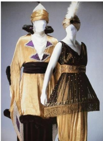
Рисунок 2 – Мужской и женский маскарадный костюм Поля Пуаре

Знаменитый костюмированный бал «1002 ночи, или Торжество по персидски», данный в его парижском особняке 24 июня 1911 года, показывает костюмы Поля Пуаре (рис. 2) [12]. После очередного турне, на этот раз из Москвы, Поль Пуаре создал русскую коллекцию «Казань» (рис.3) [13].