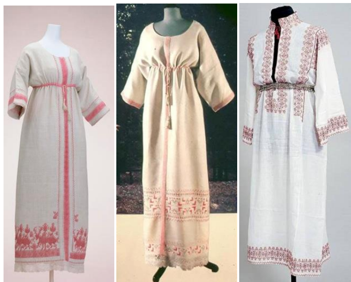
Рисунок 3 – Коллекция Поля Пуаре «Казань»