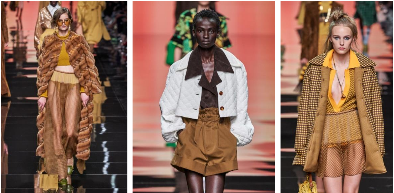
Рисунок 9 – Весна-Лето 2020 / Readytowear / Неделя Моды: Милан Fendi

объем. В современной моде можно заметить, как модельеры также активно используют эти методы. Например, в коллекции Fendi Весна-Лето 2020 / Readytowear/ Неделя Моды в Милане, представленной на рисунке 9 [10], используется многослойность, на рисунке 10 – оверсайз. [11]