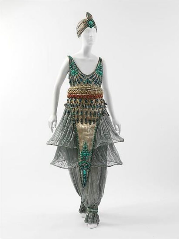
Рисунок 4 – Костюмы Поля Пуаре в Восточном стиле

4. Пуаре активно использовал яркие цвета: разные оттенки красного и зеленого, шафрановый желтый, бирюзовый.