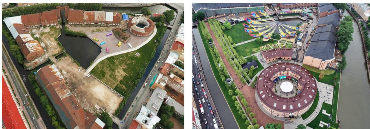
Рисунок 5. Реконструкция верфи на острове Новая Голландия, Санкт-Петербург [4], [5]