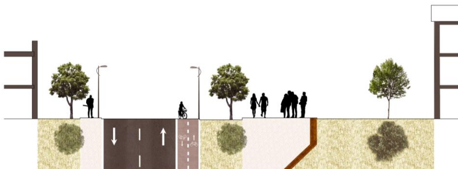
Рисунок 3. Поперечный профиль улицы