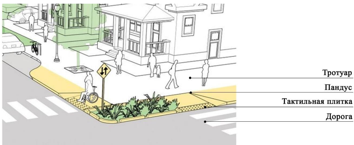
Рисунок 4. Узел пешеходного перехода с учетом МГН