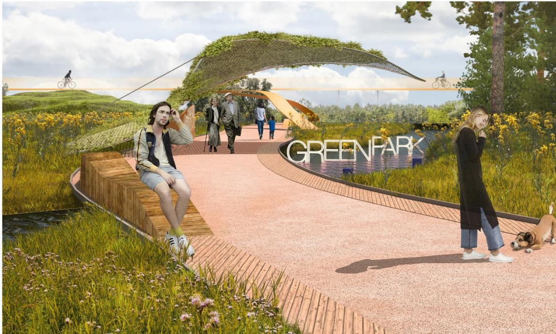
Рисунок 7. Предложение по реконструкции и озеленению парковой территории