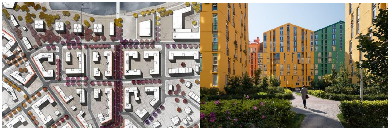
Рисунок 2. Малоэтажная квартальная застройка