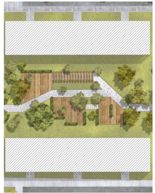
Рисунок 8. Предложение по реконструкции и озеленению дворовой территории