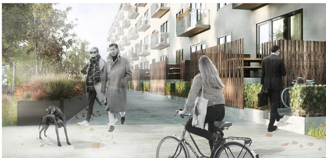
Рисунок 6. Предложение по реконструкции двора хрущевок и прилегающих к ним территорий