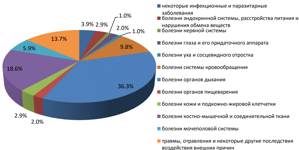
Рисунок 2. Структура причин временной нетрудоспособности среди работающих женщин 60 лет и старше

При изучении структуры заболеваемости среди работающих женщин пожилого возраста (60 лет и старше) установлено, что наибольший вклад в заболеваемость с временной утратой трудоспособности за счет заболеваний органов дыхания (36,3%), костно-мышечной и соединительной ткани (18,6%), травм, отравлений и некоторых других последствий внешних причин (13,7%) (рис.2).