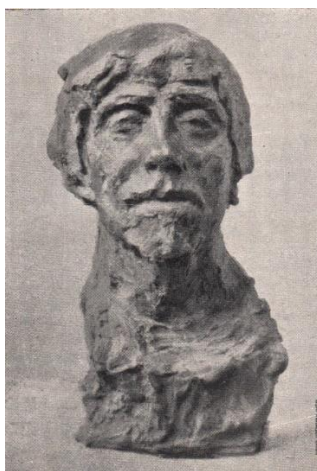
Рис. 2 "Иван Непомнящий"

человек; его лицо выглядит усталым, глаза – подслеповатыми и потухшими. Но внутренняя жизнь этого человека не угасла. Ещё теплится в нём сознание, доброта и красота души. Образ Ивана Непомнящего – это образ всего русского народа, пережившего множество страданий, но не потерявшего духовность и чистоту. Лицо Ивана Непомнящего вылеплено с истинным вдохновением. Л.П. Трифонова пишет: «Пластический язык Голубкиной достигает здесь необыкновенной выразительности, гибкости, приобретает широкую гамму оттенков, а пластика лица создаётся то резкими, контрастными сопоставлениями формы, то едва уловимыми переходами, то мелкими дробными мазками, образующими сложную неподвижную массу, скользящую светотень, трепетную вибрацию света» [6; с 22]. Таким образом, этот скульптурный портрет приобретает общечеловеческую ценность.