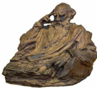
Рис. 3 Л. Н. Толстой

В портрете Л.Н. Толстого ( Рис. 3 Л. Н. Толстой) Голубкина сумела передать силу русского гения. Композиция портрета решена мощно и широко. Всё это говорит о том, что в Толстом художница видела гения, титана, охваченного целиком и полностью непокорной стихией мысли. в нём явственно ощущаются «могучий талант скульптора, её взволнованная душа, уверенная сильная рука, вызывающие к жизни образ гениального писателя» [6; с. 35].