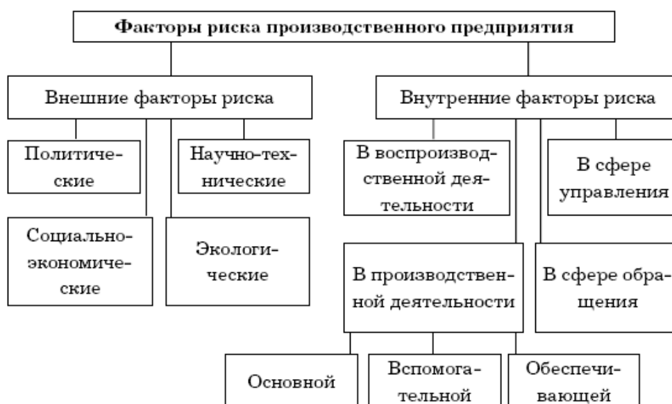
Рис. 1 Факторы риска предприятия.

Все внешние факторы риска, способные оказать влияние на деятельность и нормальное функционирование предприятия, можно разделить на политические, социальные, экономические, экологические и научно-технические.