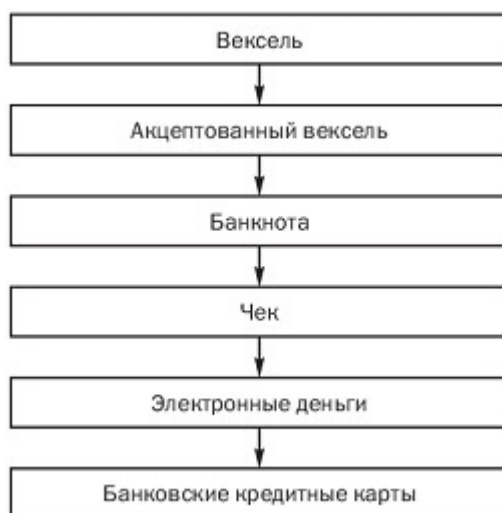
Рисунок 3 – Эволюция кредитных денег

Путь развития кредитных денег - следующий: вексель, акцептованный вексель, банкнота, чек, электронные деньги, кредитные карточки. рис. 2.