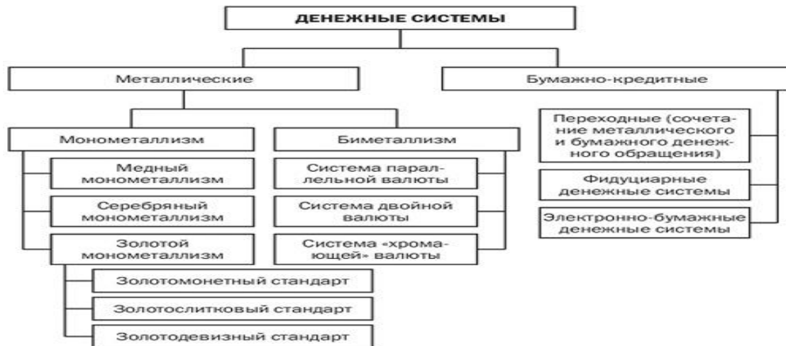
Рисунок 3 – Типология денежных систем

Денежная система представляет собой форму организации денежного обращения, сложившуюся исторически и закреплённую законодательно. Составной частью денежной системы является национальная валютная система. В зависимости от формы, в которой денежные средства функционируют в экономике, различают два типа денежных систем: система металлического обращения и система обращения денежных знаков.