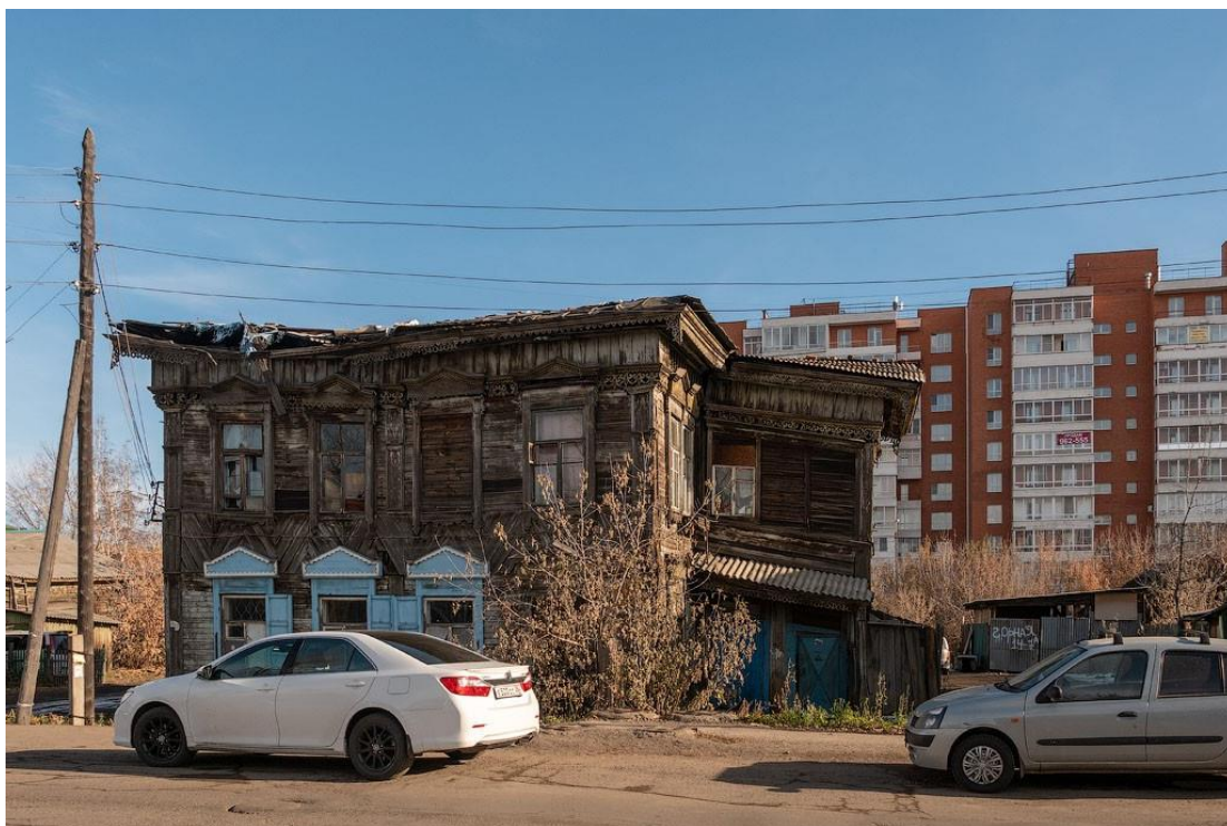
Памятник деревянного зодчества рядом с современным ЖК, г. Иркутск