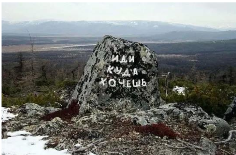
Камень Судьбы на Колыме

126. Есть трогаяющие душу каждого страницы истории, как нашего государства, так и отдельных личностей. И то куда мы идём, с какими мыслями, какой выбор мы делаем, благодарим ли мы Господа Бога, какой для себя выбираем закон, зависит от нас, согласитесь? Немалая доля всего перечисленного зависит от самих себя, согласитесь?