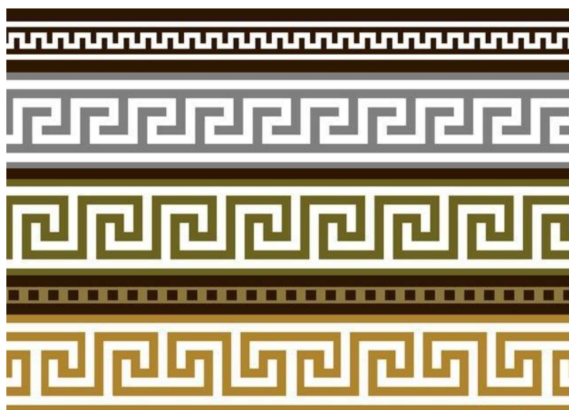
Рис. 1 - Меандр

придумывая новые вариации. Постепенно орнамент приобрёл двойные и даже тройные волны. Судя по количеству видов меандра, древние художники негласно соревновались — кто же сочинит более совершенный орнамент? И сейчас меандр сопровождает человечество: постепенно из украшений на вазах и постройках он перебрался на одежду европейских модниц, а сейчас красуется на логотипе Versace и нередко встречается как украшение интерьера. Чтобы увидеть древние примеры использования меандра, далеко ходить не придётся. Оказавшись в Греции, достаточно заглянуть в любой археологический музей, где хранится найденная археологами посуда, камни с высеченным на них меандром, фрагменты зданий.