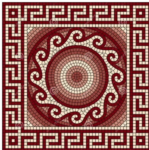
Рис. 2 - Спираль

орнаменты — такие завитки называют «волютами». Но в древнегреческой архитектуре существовали также оббегающие и S-образные спирали.