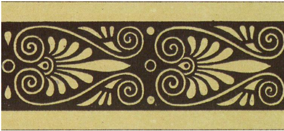
Рис. 3 - Акант