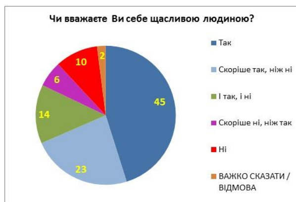
Рис. 1. Результати соціологічного опитування самооценки рівня щастя населенням України.

По сравнению с 2018 годом, процент счастливых людей в Украине в 2020 году вырос на 6 процентных пунктов (было 63%, стало 69%). В 2019 году вопрос не ставился.