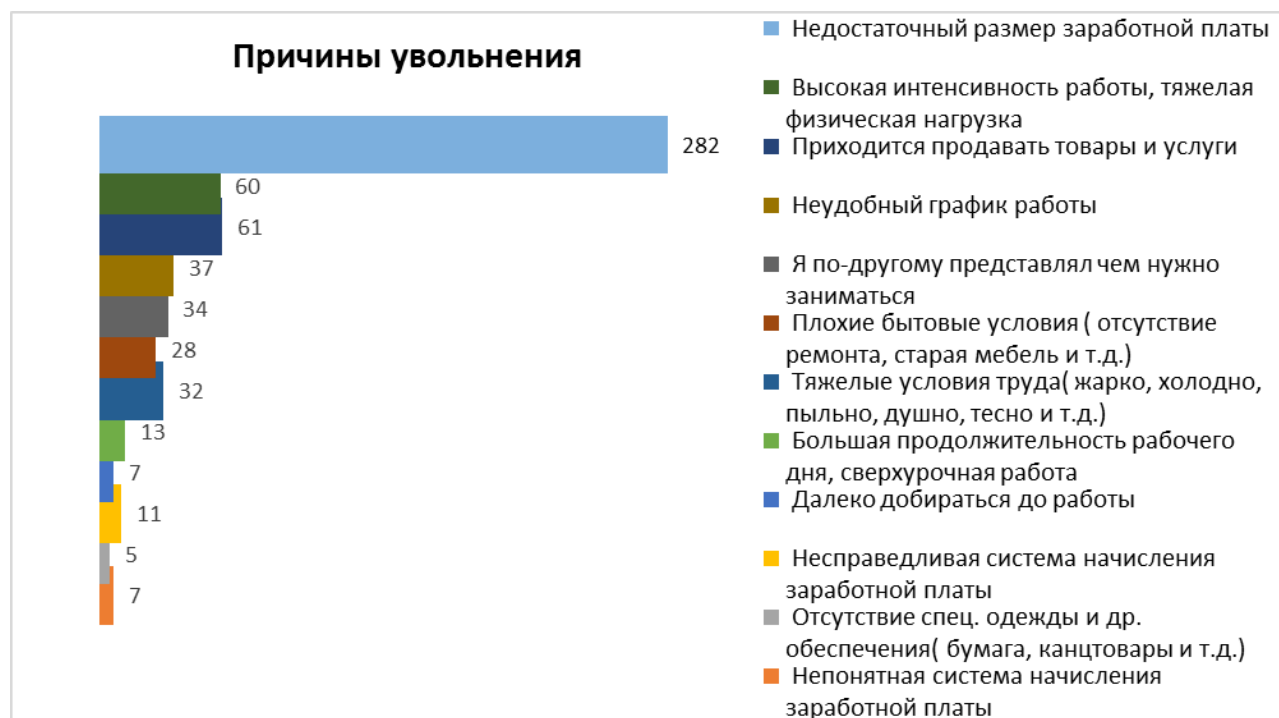
Рис. 2. Анализ причин увольнения (за 1 месяц после снятия жестких коронавирусных ограничений)

Как и до пандемии, основной причиной смены работы в период пандемии стал «недостаточный размер заработной платы» - 245 сотрудников (38%) из 645 респондентов, после снятия ограничений ее указали 282 сотрудника (35%) из 800.