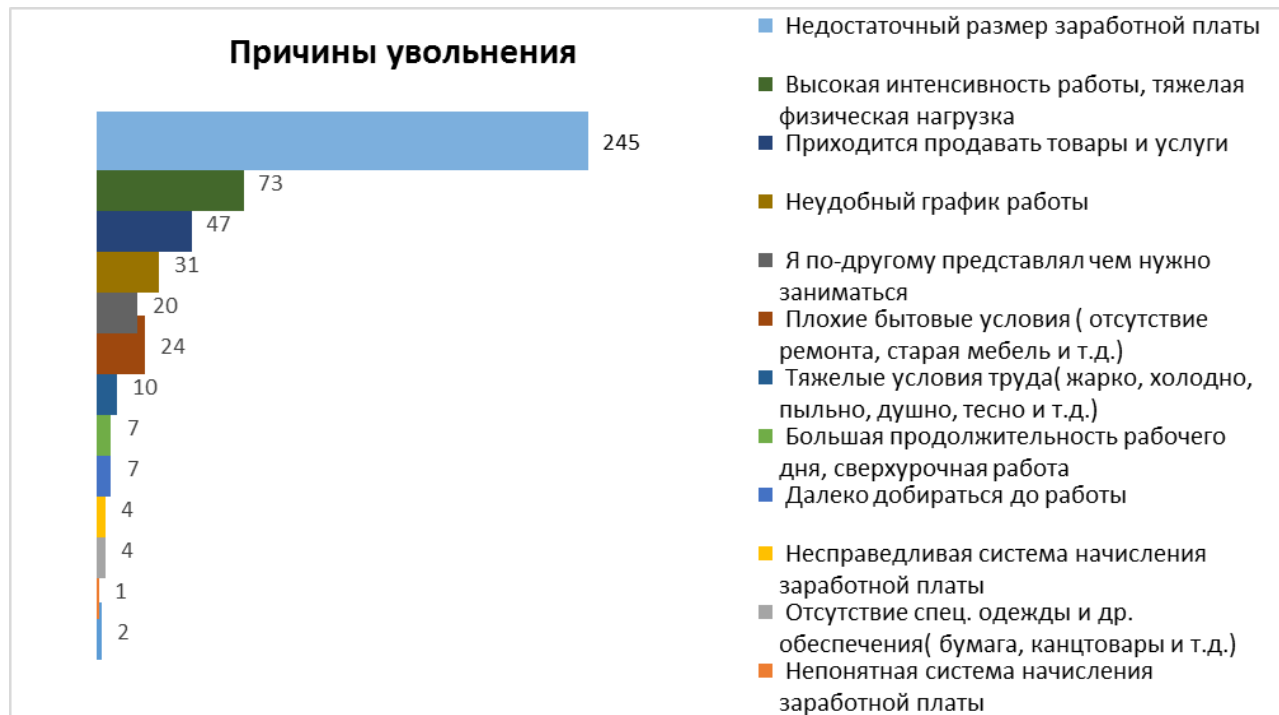
Рис. 1. Анализ причин увольнения (за 1 месяц в период коронавирусных ограничений)

Рассмотрим более подробно результаты анкетирования. На рис. 1 и рис. 2 представлены основные причины увольнения сотрудников в период коронавирусных ограничений и сразу после снятия жестких ограничений.