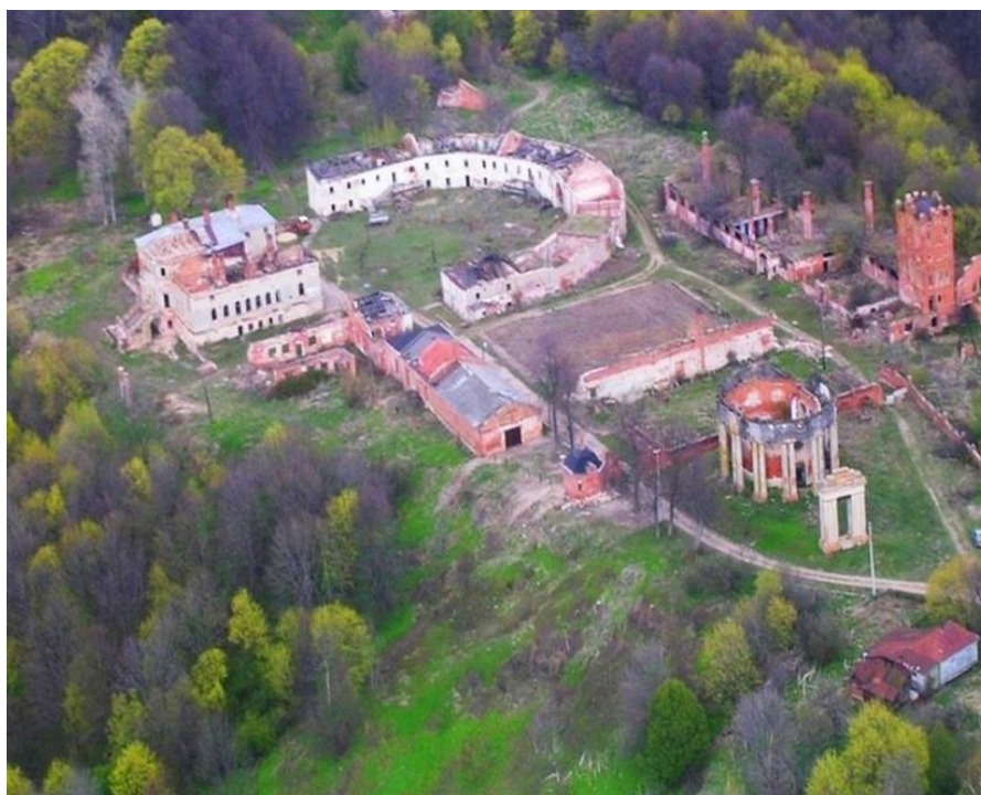
Рисунок 2 – Структура усадебного комплекса Приклонских-Рукавишниковых, с.Подвязье, Богородский район Нижегородской области

Исторически сложившиеся структурные элементы усадьбы, обеспечивающие единство всего комплекса, содержали в себе все существующие элементы структуры современного ей культурного мира: весь цикл жизни, проходящей внутри усадьбы, поддерживался ее внутренним пространством бытия, в котором предусматривались места проведения хозяйственных работ и праздников, культовых богослужений и повседневного обихода, парадных пространств и парковых перспектив [2]. Типичный интерьер эпохи — барский дом, в котором «мужской кабинет», «гостиная», «женский кабинет», «театр», «портретная», «столовая», «спальня». Обязательный атрибут - домовая церковь. Усадьба немыслима без вековых парков, каскадных прудов с карасями, без хозяйственных флигелей, конюшен и псарен. На Рисунке 1 представлена структура усадьбы Приклонских-Рукавишниковых в селе Подвязье Нижегородской области.