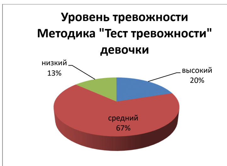
Рисунок 2. Диаграмма: Результаты обследования девочек по методике - Р.Тэммл, М. Дорки, В. Амен - Тест тревожности

Высокий уровень тревожности среди девочек был выявлен у 20%, что составляет 3 ребёнка. Дети тревожные, пугливые, напряжённые, со сниженной самооценкой, неуверенные в себе, не умеющие налаживать отношения со сверстниками, со сниженным настроением, не достаточно общительные, к окружающим людям проявляют подозрительность и недоверчивость.