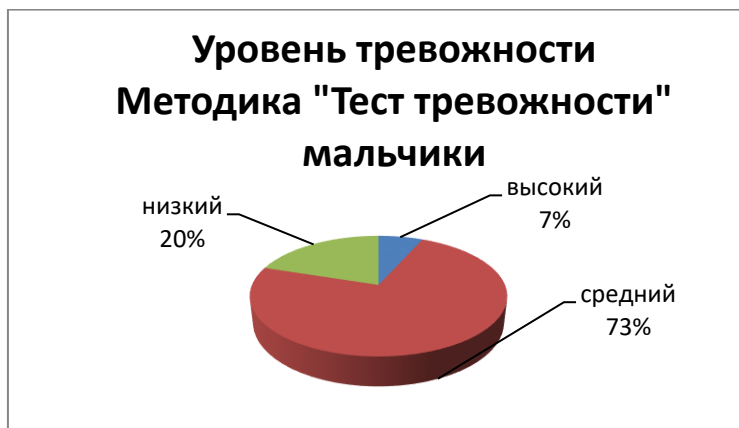
Рисунок 1. Диаграмма: Результаты обследования мальчиков по методике - Р.Тэммл, М. Дорки, В. Амен - Тест тревожности

Анализ результатов эмпирического исследования позволил нам определить особенности эмоциональной сферы детей старшего дошкольного возраста. Результаты обследования по методике - Р.Тэммл, М. Дорки, В. Амен – «Тест тревожности» представлены на рисунке 1. и рисунке 2.