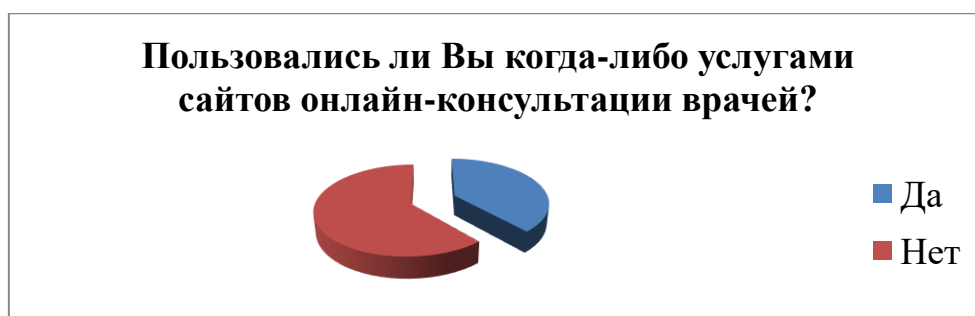
Рис. 1 Распределение мнения респондентов при ответе на вопрос «Пользовались ли Вы когда-либо услугами сайтов онлайн-консультации врачей?»

Второй вопрос : «Считаете ли Вы, как будущие врачи, возможным выяснить точный диагноз, работая с пациентом, обследуя его только через интернет ?» показал, что подавляющее большинство ( 96%) считает невозможным выяснить точный диагноз при помощи онлайн-консультаций. (рис. 2) .