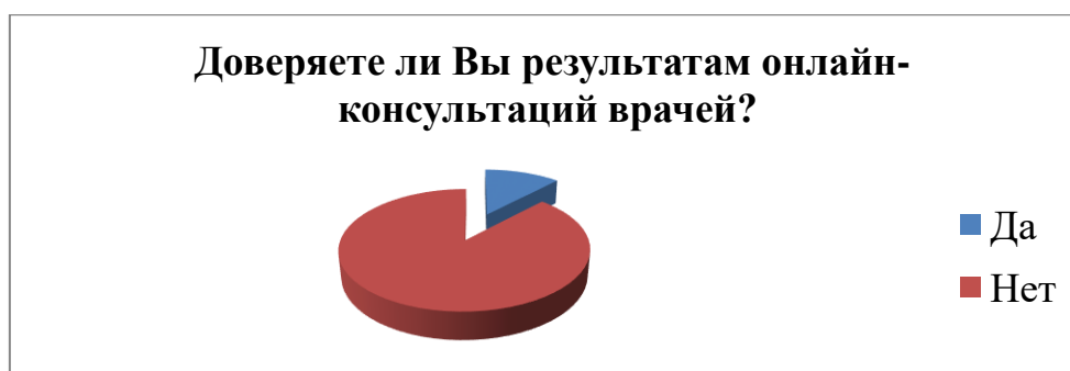
Рис. 3 Распределение мнения респондентов при ответе на вопрос : «Доверяете ли Вы результатам онлайн-консультаций врачей?»

Четвёртый вопрос : «Рассматриваете ли Вы проведение медицинских онлайн-консультаций как дополнение к своей будущей профессии?» показал, что 60% опрошенных студентов рассматривают проведение медицинских онлайн-консультаций в будущем (рис. 4) .