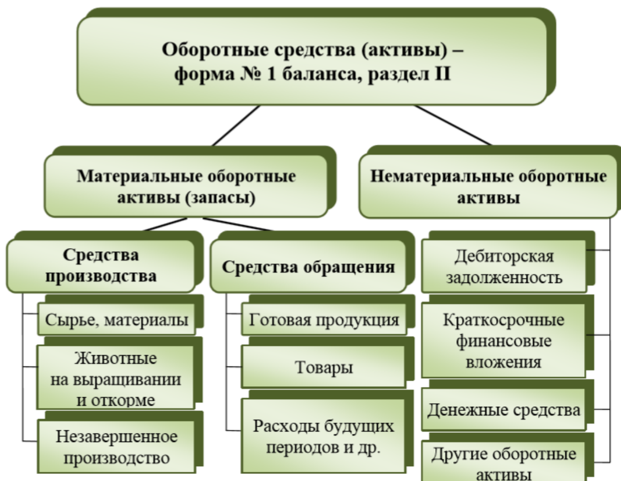
Рисунок 1 – Общая классификация оборотных средств

Результаты. Как видно из таблицы 1 среднегодовая стоимость оборотных средств увеличилась на 18,5%, в основном за счет увеличения стоимости запасов, которые составляют более 80% в общей структуре оборотных средств [3, с. 56].