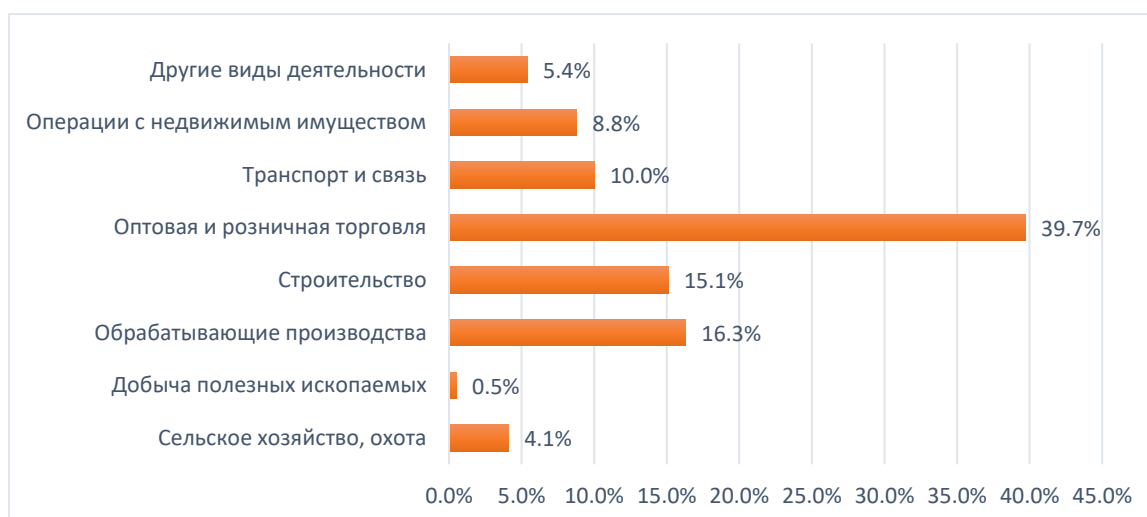
Рисунок 3 – Основные виды деятельности субъектов малого предпринимательства [1]

Рассмотрим основные виды деятельности, которые характерны для субъектов малого предпринимательства на рисунке 3.